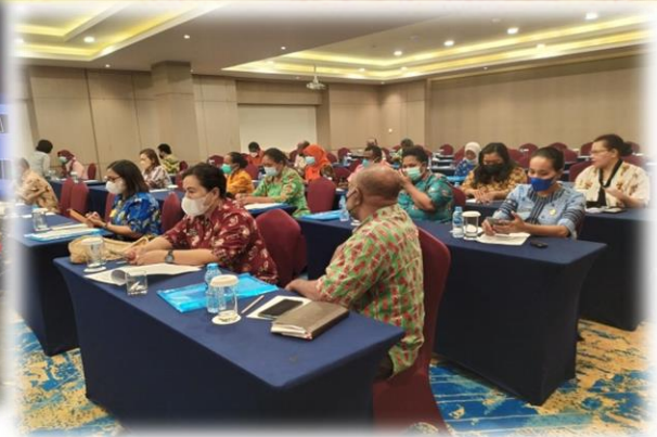
LAKIP KOMINFO BIAK NUMFOR